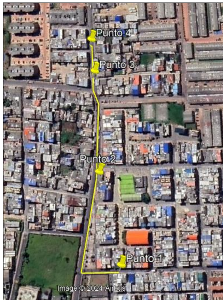
Ilustración 1. Recorrido verificación ambiental

Con base en lo anterior, el día 07 de septiembre de 2024 se realizó recorrido de control y vigilancia en los barrios Serrezuelita-Porvenir desde las coordenadas 4°42'33,031"N- 74°12'48,477"W hasta las coordenadas 4°42'24,682"N- 74°12'41,415"W (ver ilustración 1. Ruta amarilla).